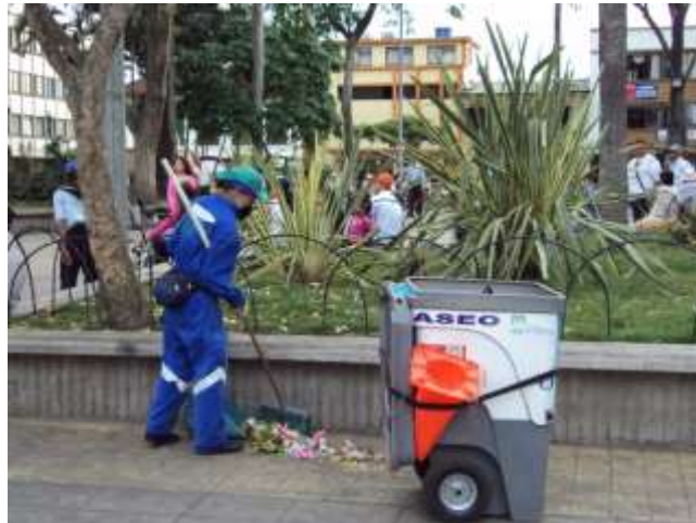
Foto No. 2 Dotación Actividad de Barrido